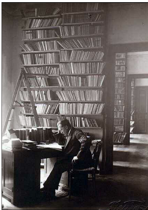
A Protestáns Teológiai Intézet könyvtárában