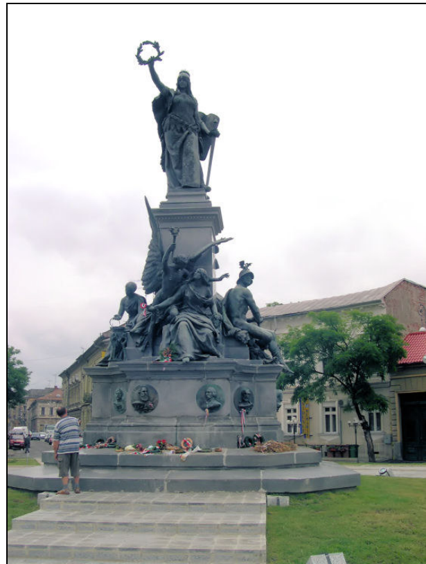
Az aradi Szabadság szobor